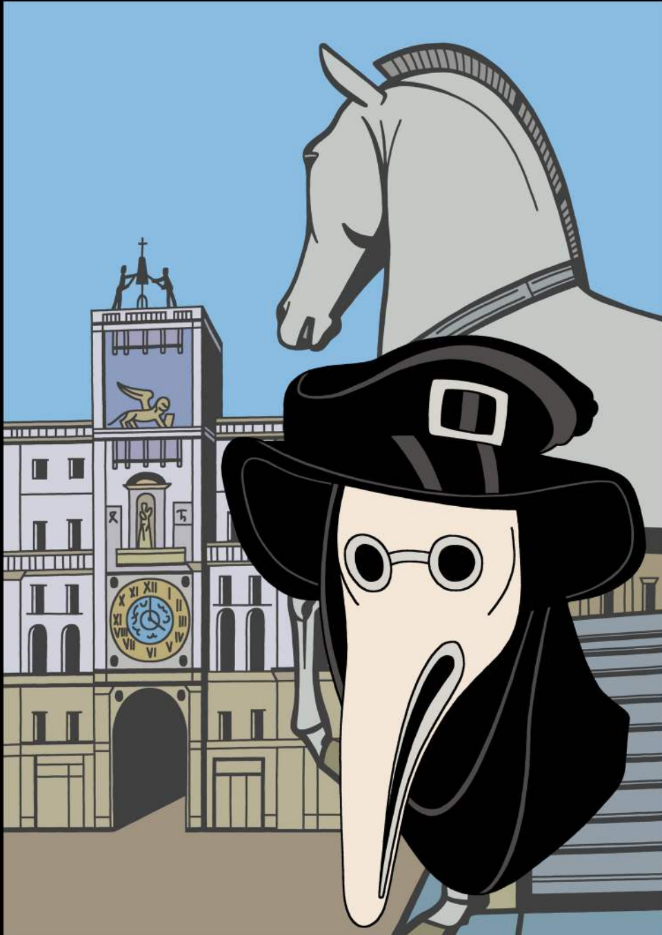
DOTTORE DELLA PESTE