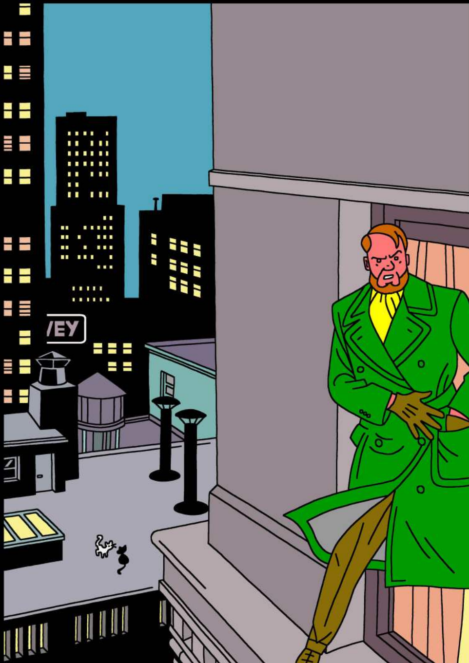
CLIFTON A NEW YORK