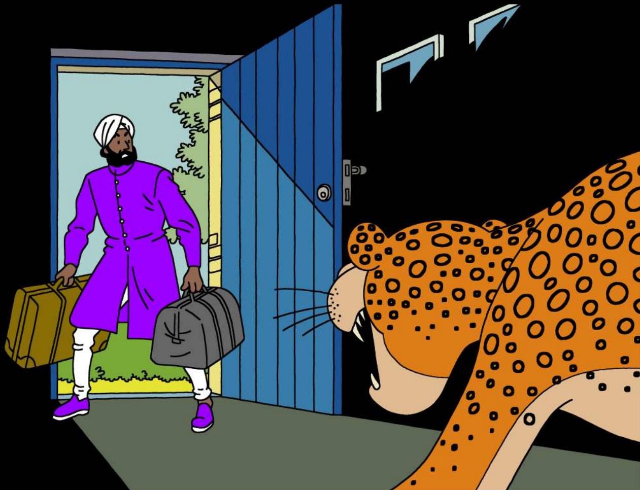
UNE PANTHERE POUR LE COLONEL