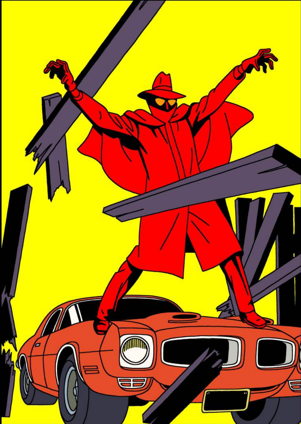
ALIAS LORD "X"